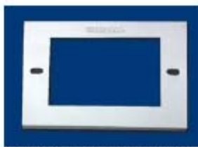
TAPA P/CONTACTO UNIVERSAL